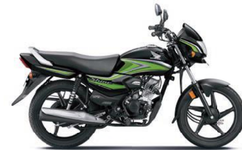
ग्रीन के साथ ब्लैक