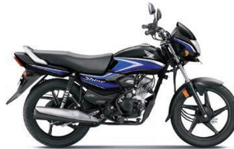
ब्लू के साथ ब्लैक