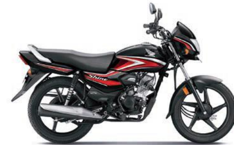
रेड के साथ ब्लैक