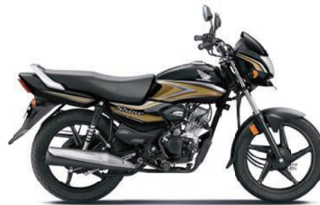
गोल्ड के साथ ब्लैक