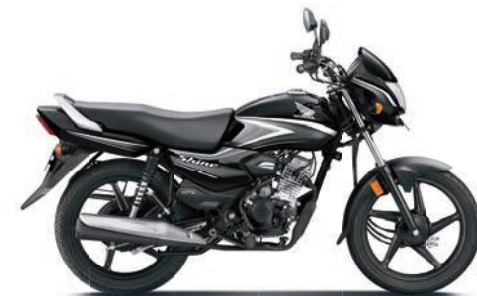
ग्रे के साथ ब्लैक

अभी ऑनलाइन बुक करें! www.honda2wheelerindia.com